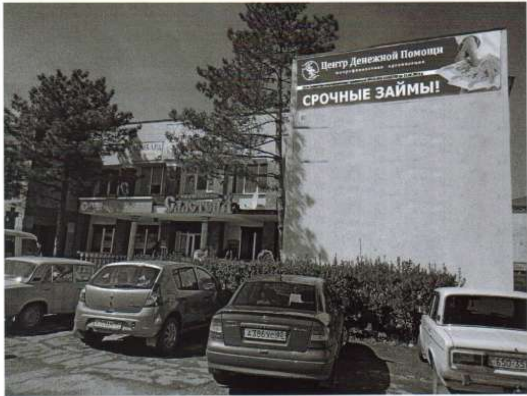
Макет рекламной конструкции на фасаде здания